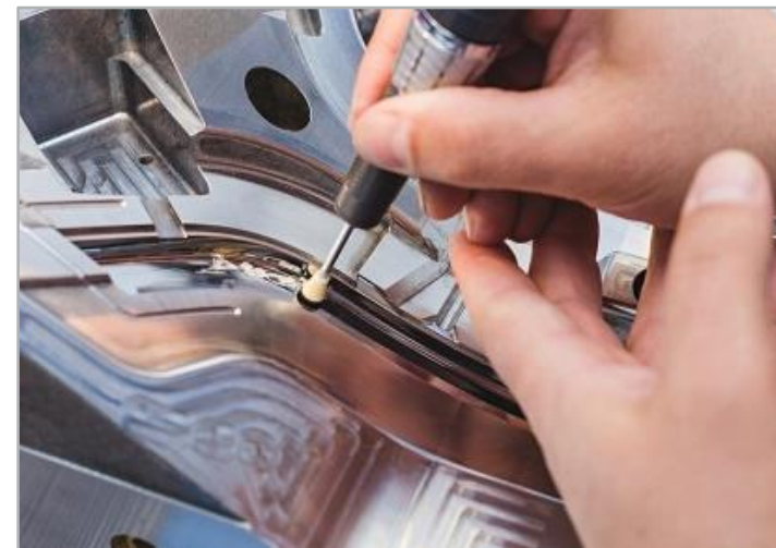
Detail leštění světlometu pro automobilový průmysl