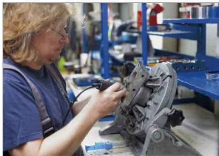
Detail leštění světlometu pro automobilový průmysl