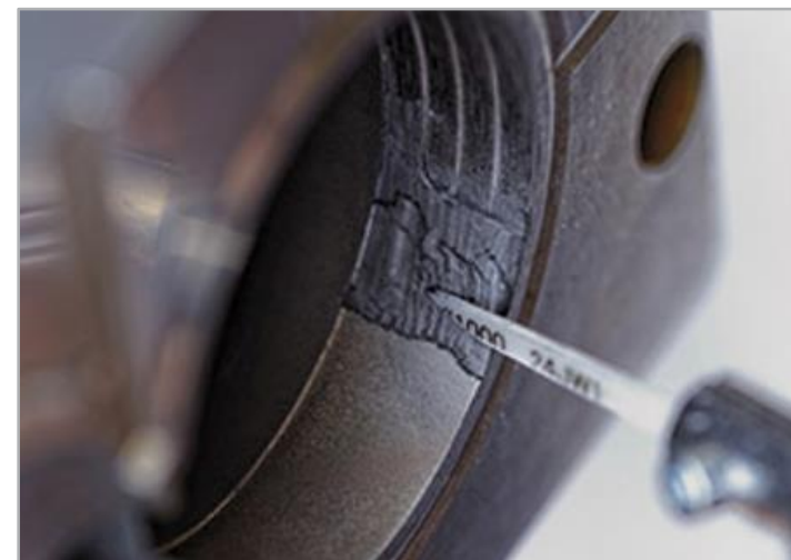
Detail leštění světlometu pro automobilový průmysl