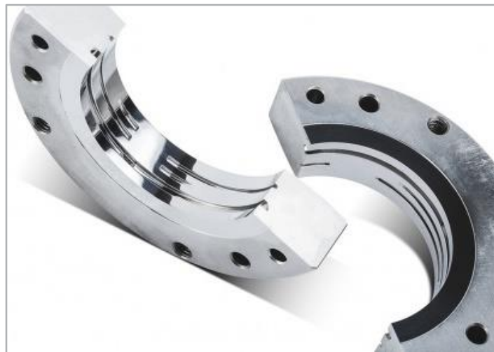
Ukázka zrcadlového leštění vnitřního průměru a drážek tvaru